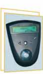
LCD kijelzős programkapcsoló