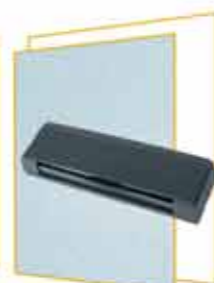
Aktív infravörös biztonsági fotocellák