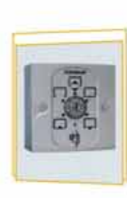
6 állású kulcsos programkapcsoló